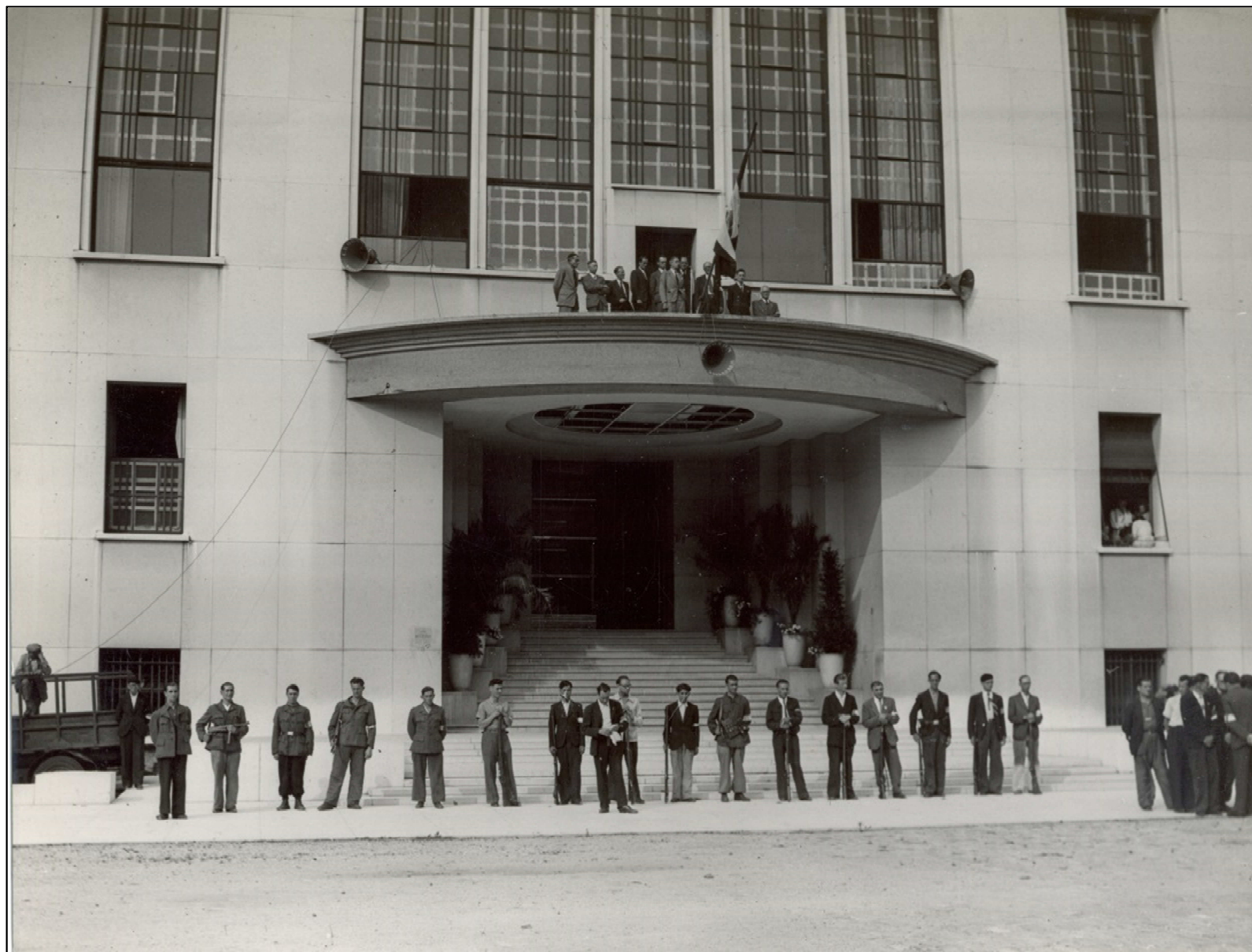
Archives municipales, 2 Fi 4746