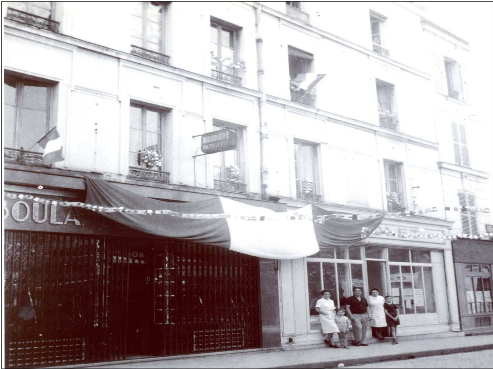
Le drapeau tricolore sur la façade de la crémierie Solet, 44 rue Escudier