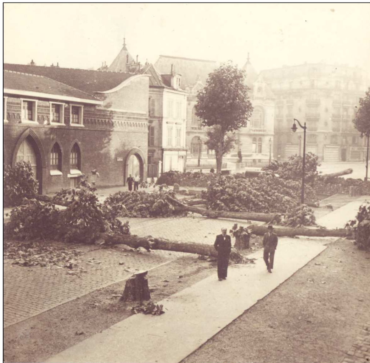
Barricade avenue Jean-Baptiste Clément Archives municipales, 2 Fi 4746