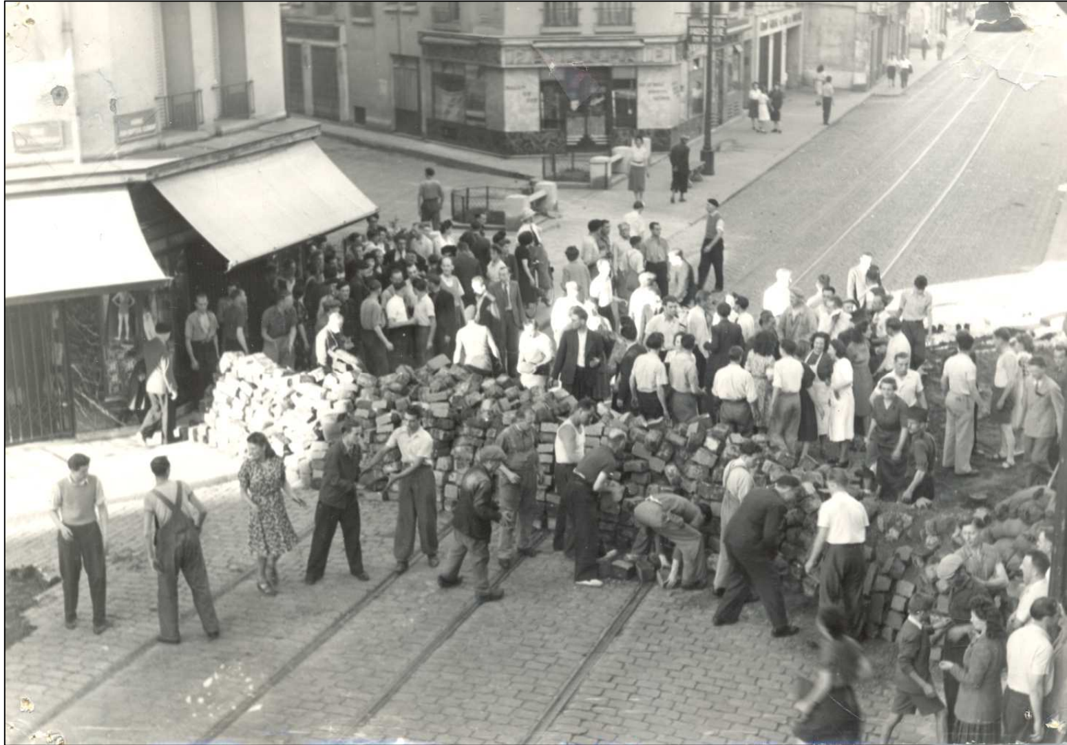
Barricade avenue Jean-Baptiste Clément Archives municipales, 2 Fi 4734