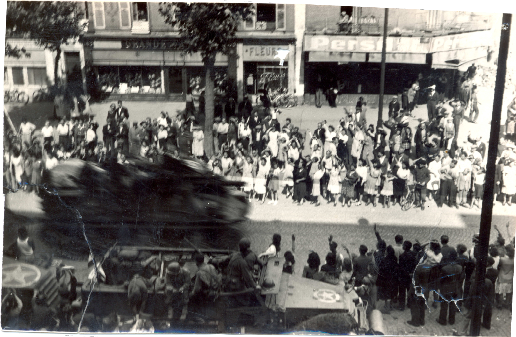
Vers le 34 avenue du Général Leclerc Archives Municipales, 2 Fi 4748