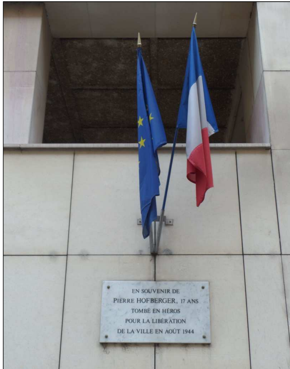
Plaque commémorative à l'école Ferdinand Buisson