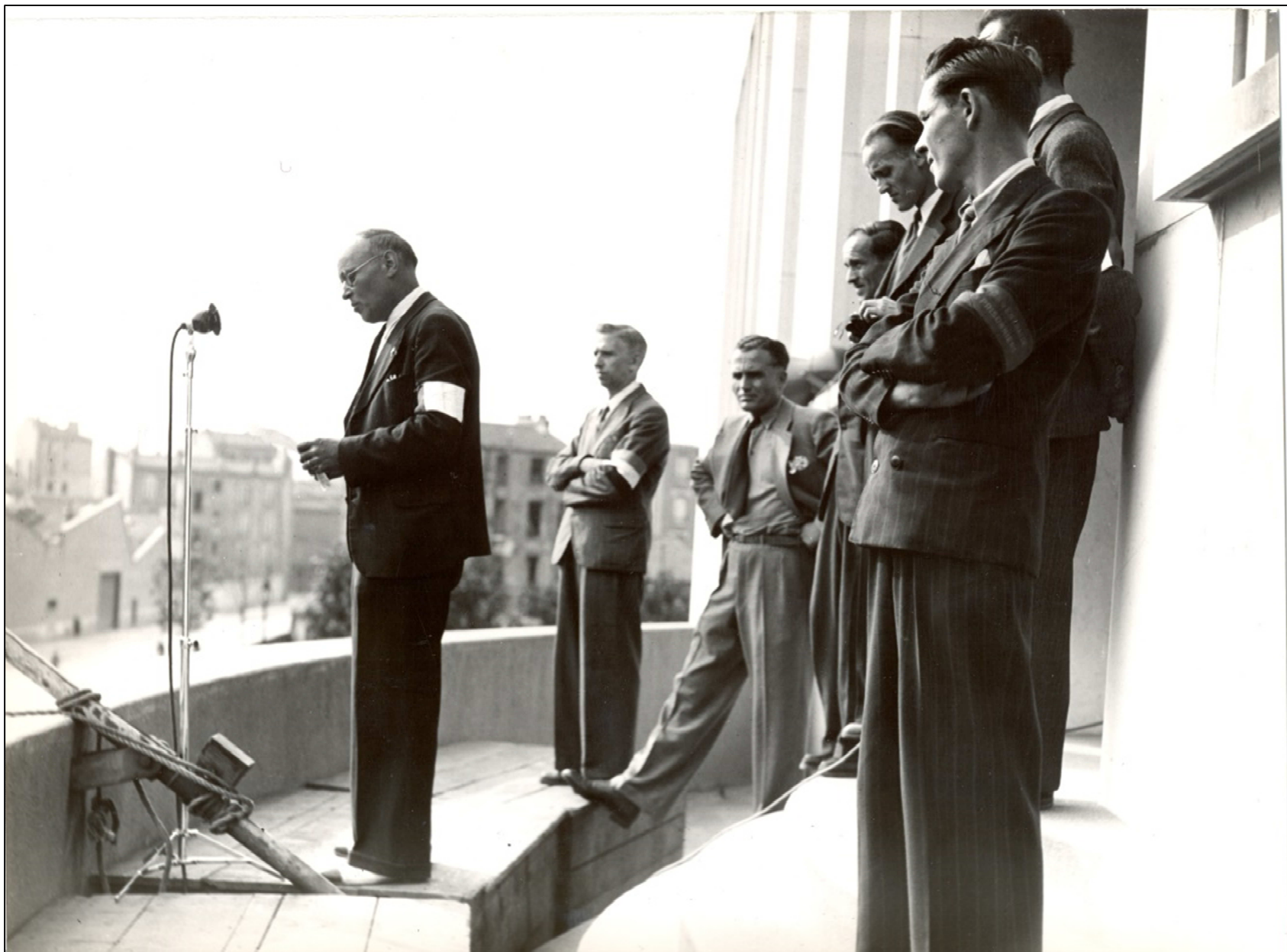
Archives municipales, 2 Fi 4780