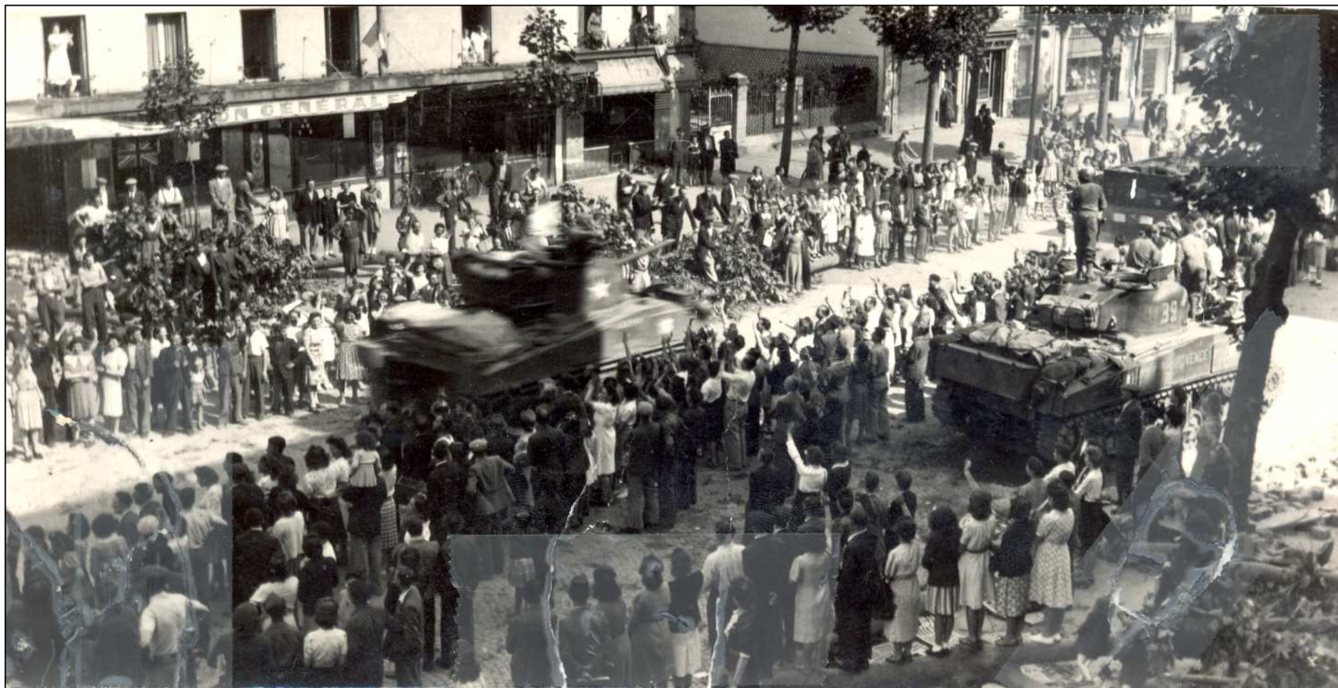
Vers le 34 avenue du Général Leclerc Archives municipales, 2 Fi 4747