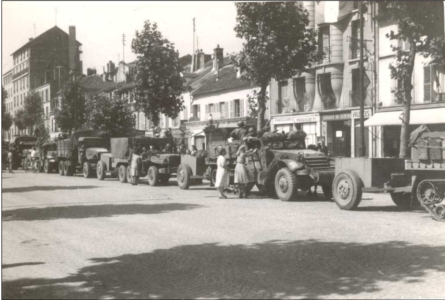
52 avenue du Général Leclerc Archives municipales, 2 Fi 4741