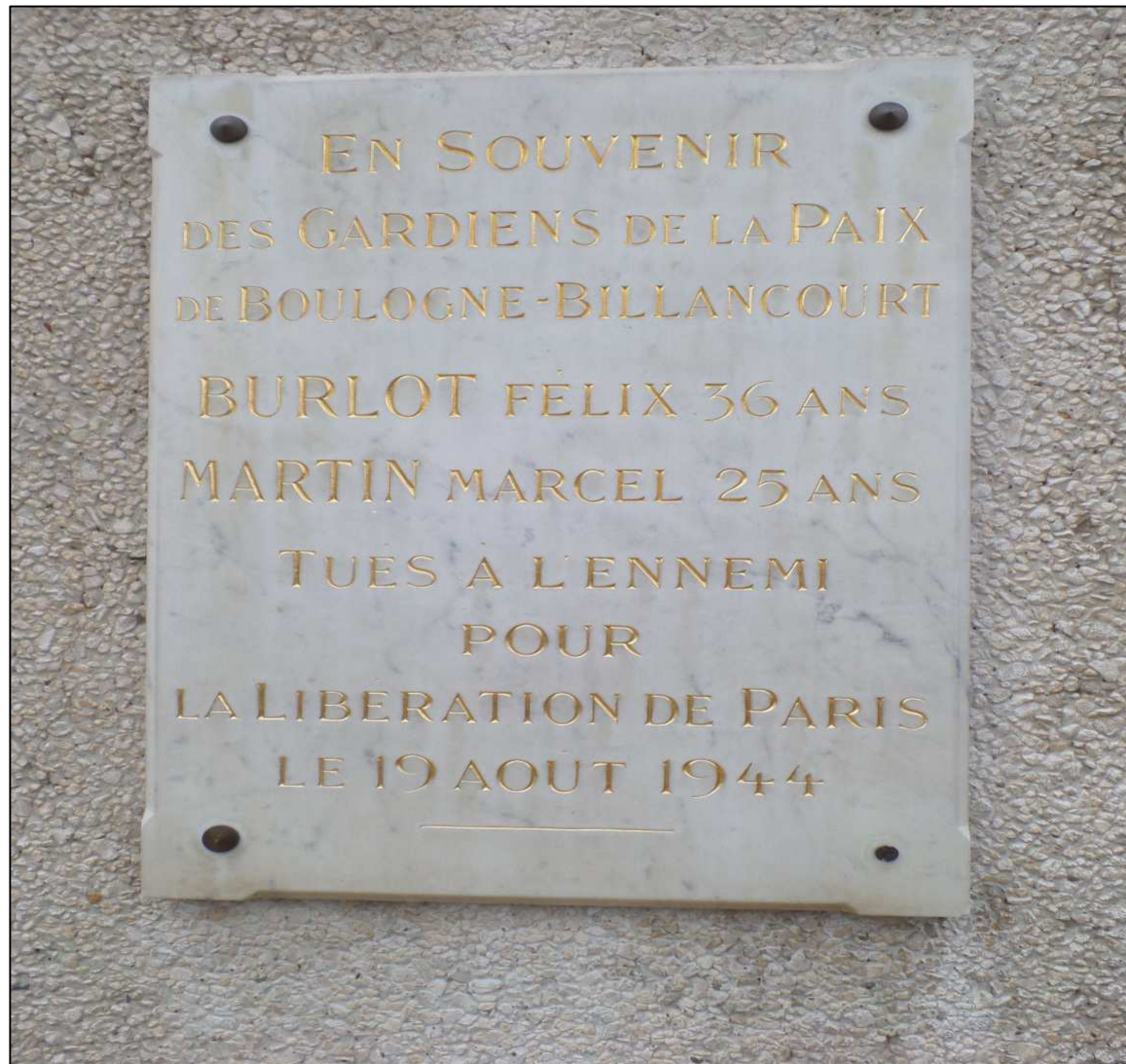
Plaque commémorative au commissariat de police