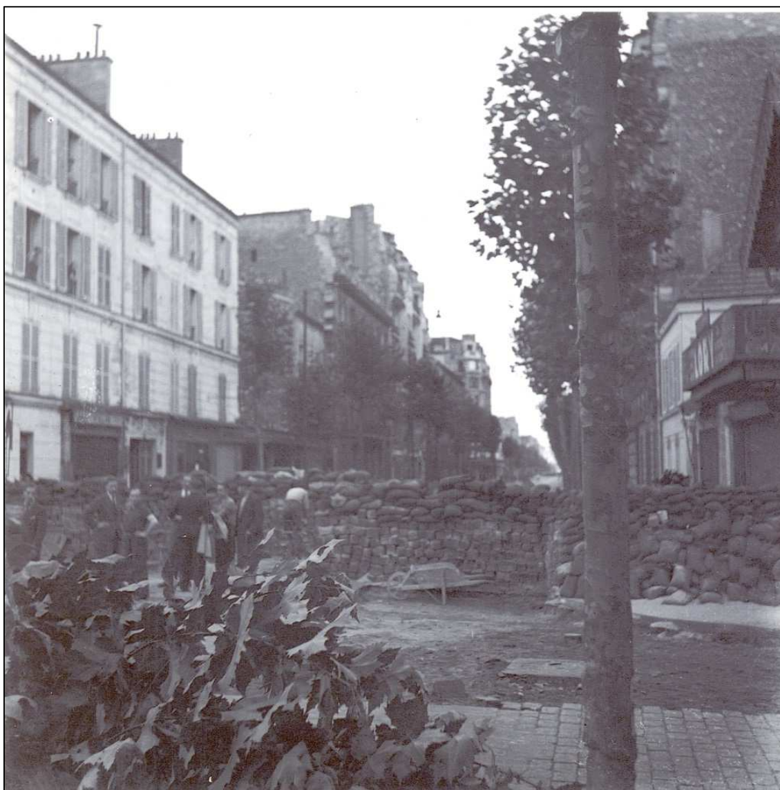
Barricade angle rue Escudier et boulevard Jean Jaurès