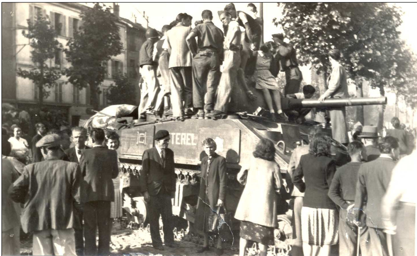
Archives municipales, 2 Fi 4735