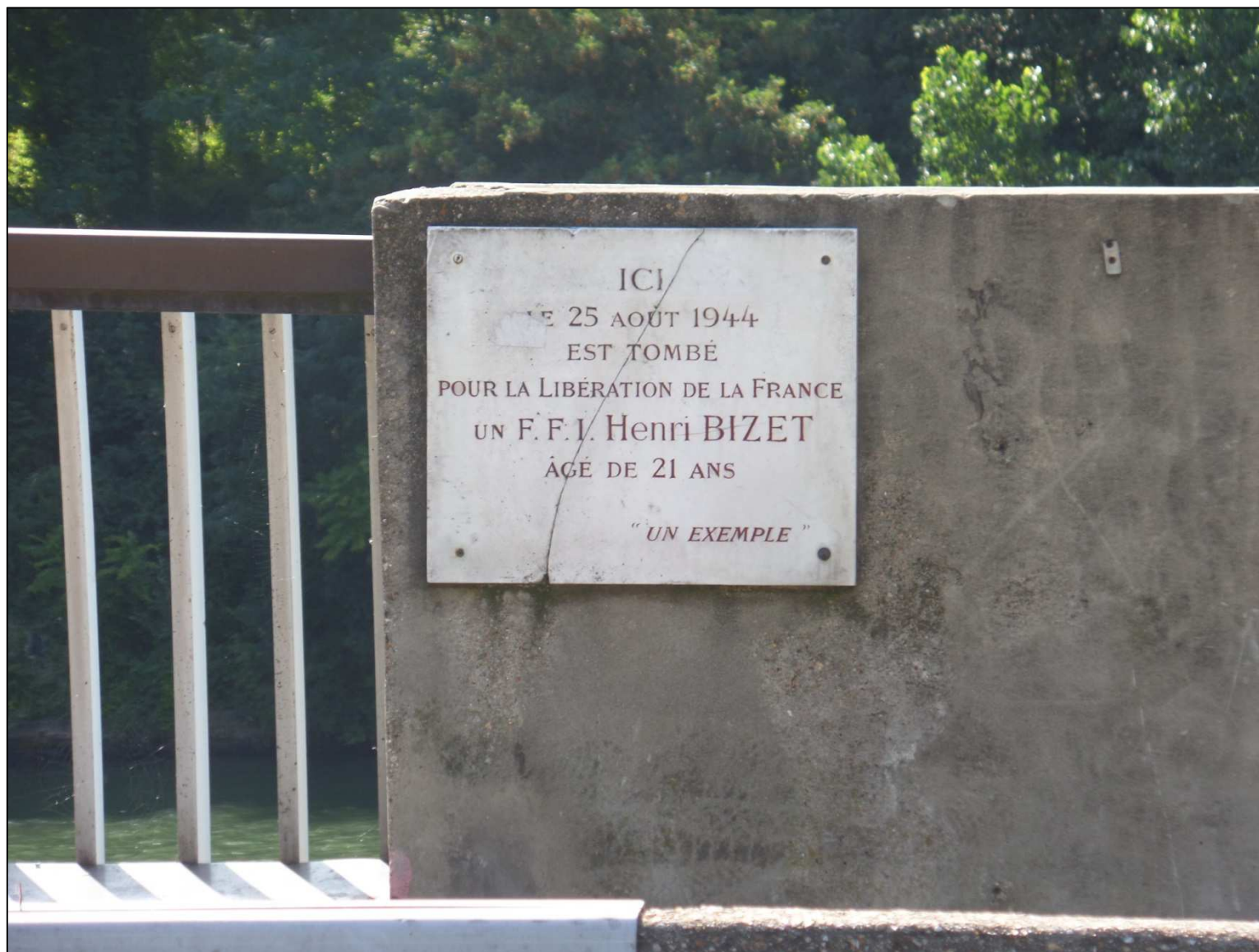
Plaque commémorative au pont d'Issy