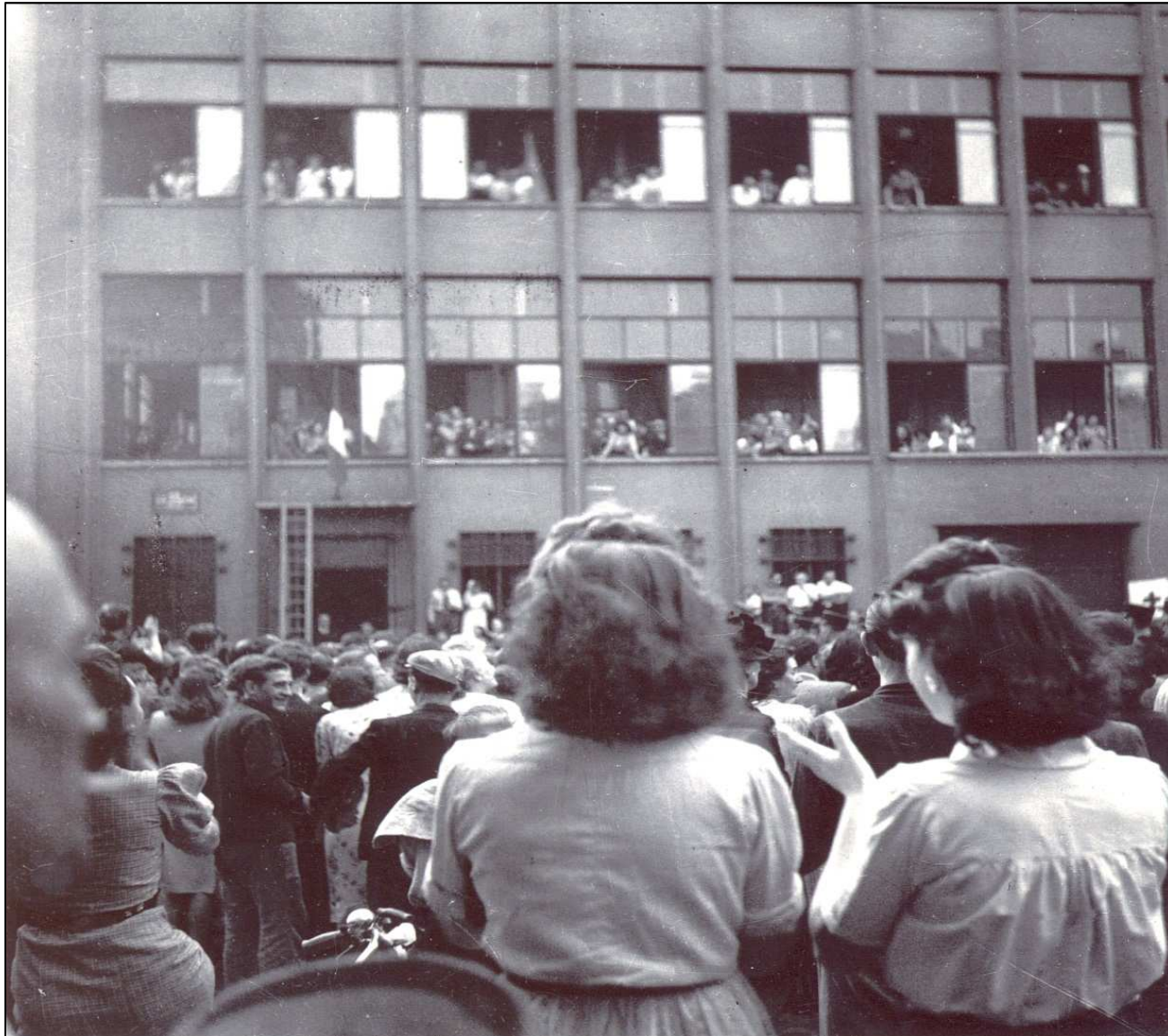
Foule à l'Hôtel de Ville