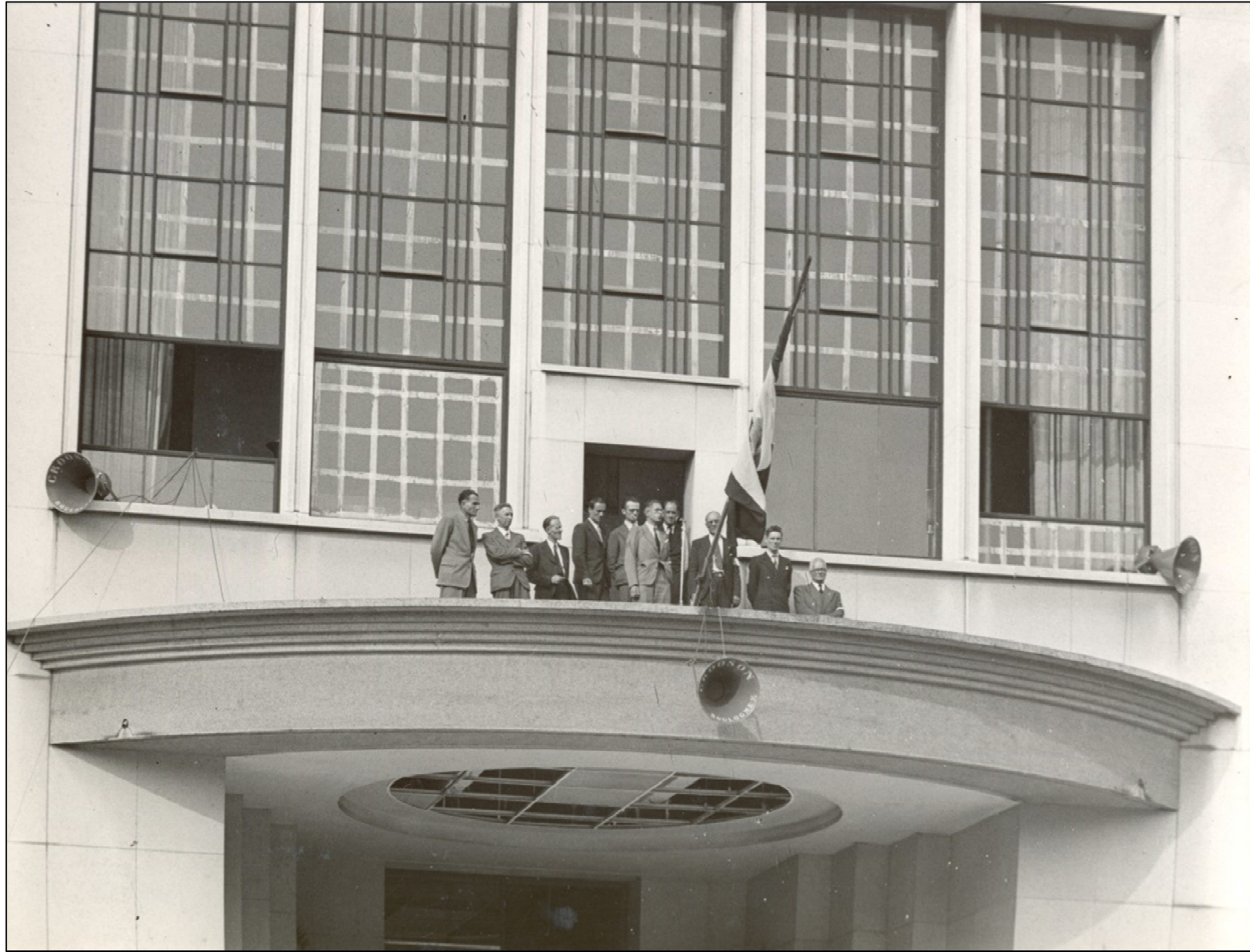
2 Fi 4782