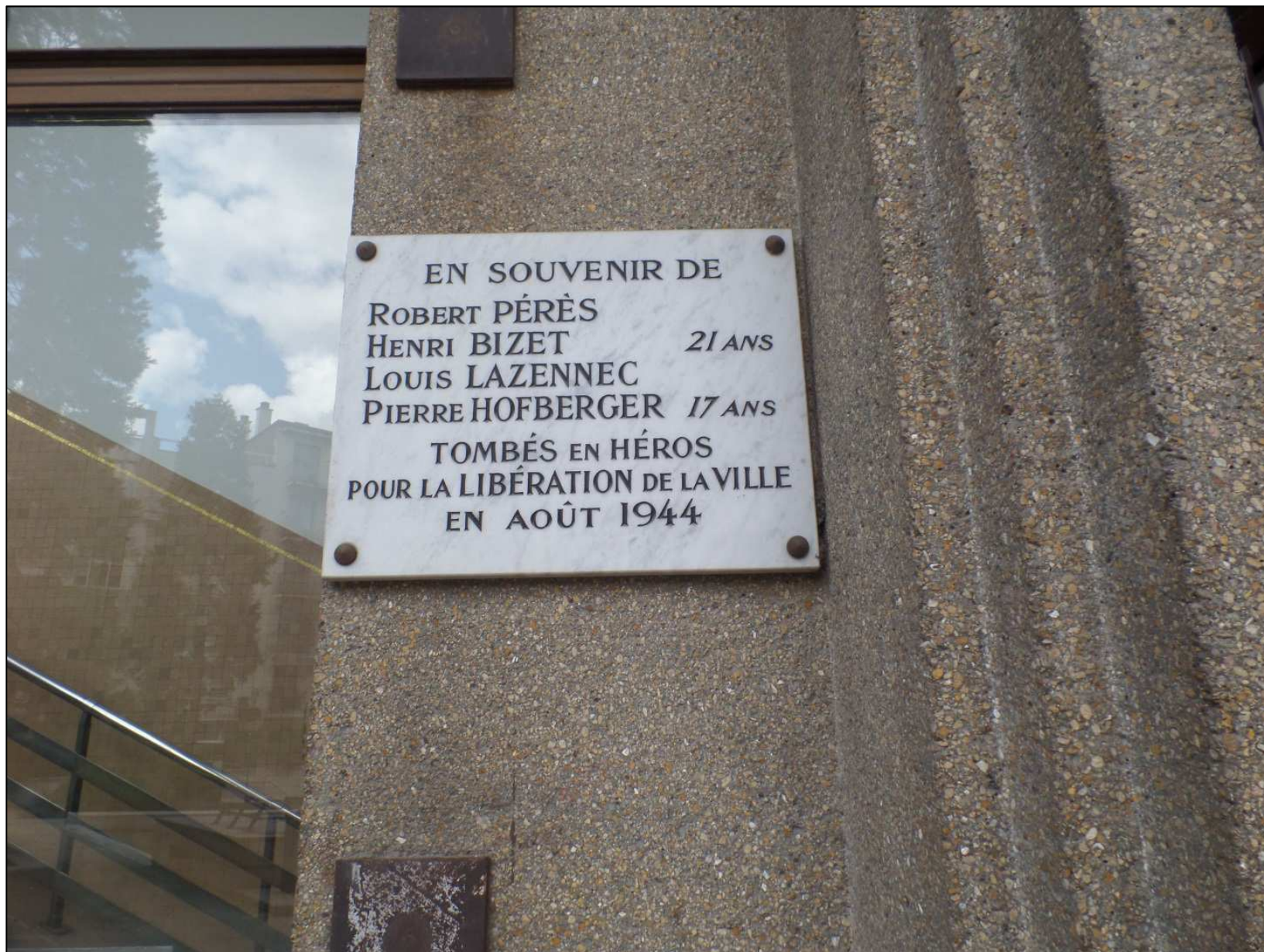
Plaque commémorative à l'Hôtel de Ville