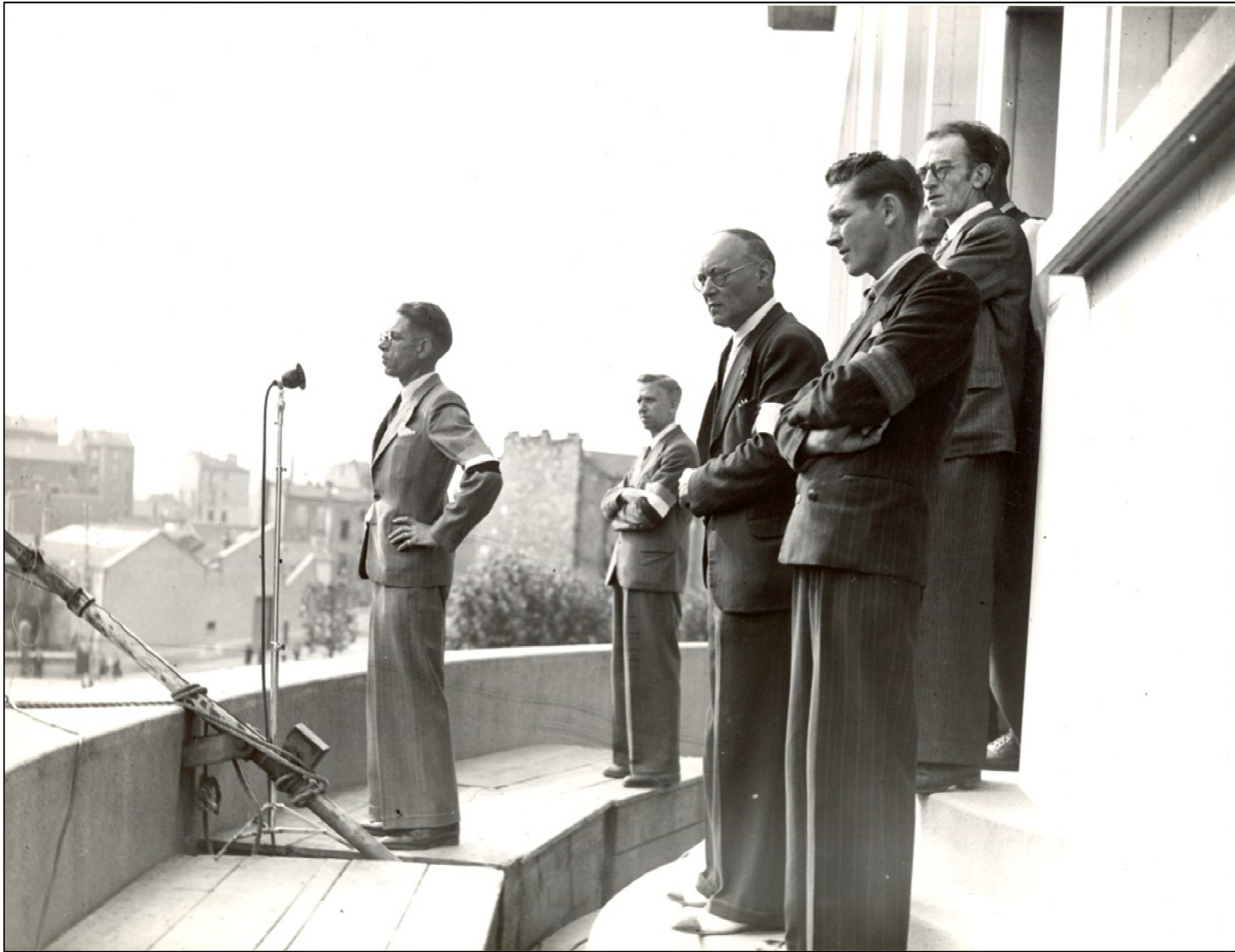
Archives municipales, 2 Fi 4777