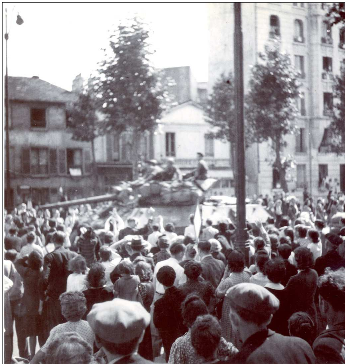
Place Marcel Sembat Archives municipales, don Solet